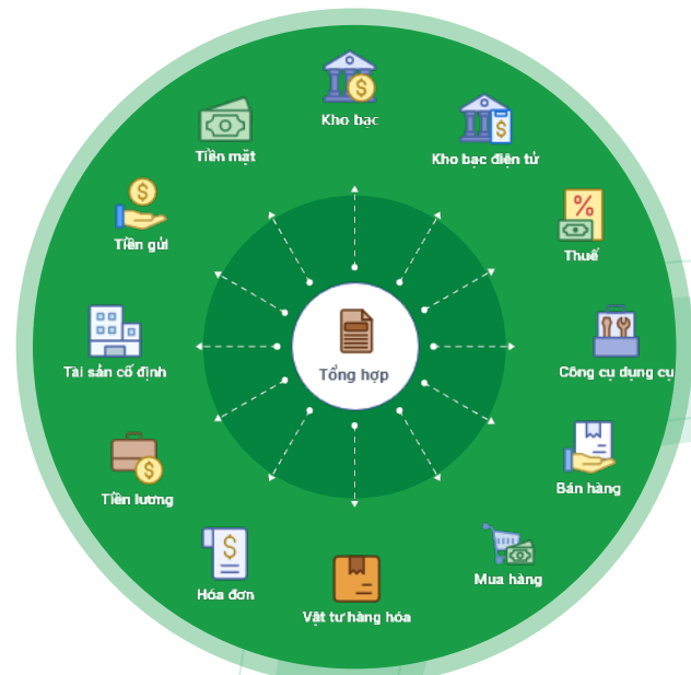
Phần mềm MISA Mimosa Online đáp ứng đầy đủ nghiệp vụ kế toán HCSN và quản lý thu - chi ngân sách Nhà nước.

Hiện nay, MISA Mimosa Online đã và đang được tin tưởng sử dụng tại gần 50.000 đơn vị HCSN. Với sứ mệnh phụng sự xã hội, MISA cam kết sẽ đồng hành cùng trường Mầm non Thành Công nói riêng và các đơn vị HCSN nói chung chuyển đổi số toàn diện, tối ưu hóa nghiệp vụ kế toán.