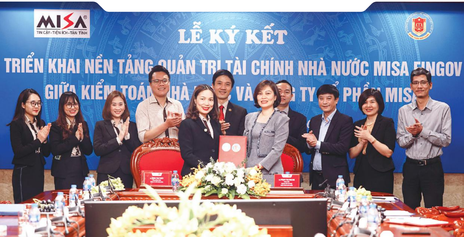
Kiểm toán nhà nước và MISA ký kết triển khai Nền tảng quản trị tài chính Nhà nước MISA FinGov.

Từ những khó khăn trong bước đầu số hóa, đến nay, KTNN đã đạt được những thành tựu tích cực và là một trong những đơn vị đi đầu trong công tác chuyển đổi số. Thành công của KTNN chắc chắn sẽ là động lực để các đơn vị, cơ quan Nhà nước tiếp tục kiên định với mục tiêu chuyển đổi số, từ đó góp phần xây dựng Chính phủ điện tử, hướng tới hiện thực hóa công cuộc chuyển đổi số quốc gia đến năm 2025, định hướng đến năm 2030 của Thủ tướng Chính phủ.