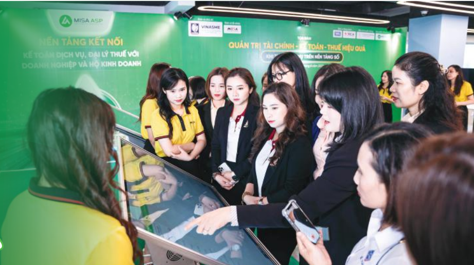
Tọa đàm thu hút đông đảo doanh nghiệp và kế toán dịch vụ tham gia.

Cả nước hiện có hơn 900.000 doanh nghiệp ở quy mô nhỏ, siêu nhỏ đang đóng góp quan trọng cho sự phát triển kinh tế. Bên cạnh đó là hơn 5 triệu hộ kinh doanh cá thể đang hoạt động.