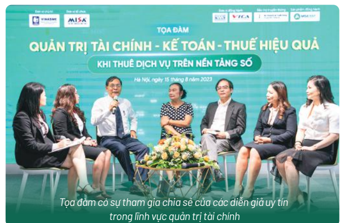
Tọa đàm có sự tham gia chia sẻ của các diễn giả uy tín trong lĩnh vực quản trị tài chính

MISA ASP hiện đang kết nối với hơn 1.500 đơn vị kế toán dịch vụ, phục vụ hơn 20.000 doanh nghiệp, hộ kinh doanh. Đây là nền tảng số quốc gia được kỳ vọng đóng góp tích cực thúc đẩy công cuộc chuyển đổi số ngành tài chính - kế toán tại Việt Nam.