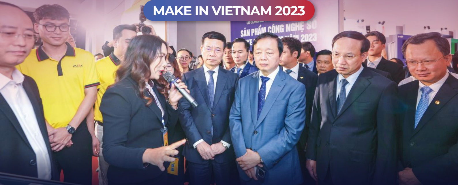
Phó Thủ tướng Chính phủ Trần Hồng Hà, Bộ trưởng Bộ TT&TT Nguyễn Mạnh Hùng cùng lãnh đạo các bộ ngành tham quan gian hàng và đánh giá cao các giải pháp chuyển đổi số của MISA.

Tại Lễ trao giải thưởng “Make in Vietnam 2023”, giải pháp MISA QLTS và MISA ASP do MISA phát triển được vinh danh là sản phẩm công nghệ số xuất sắc.